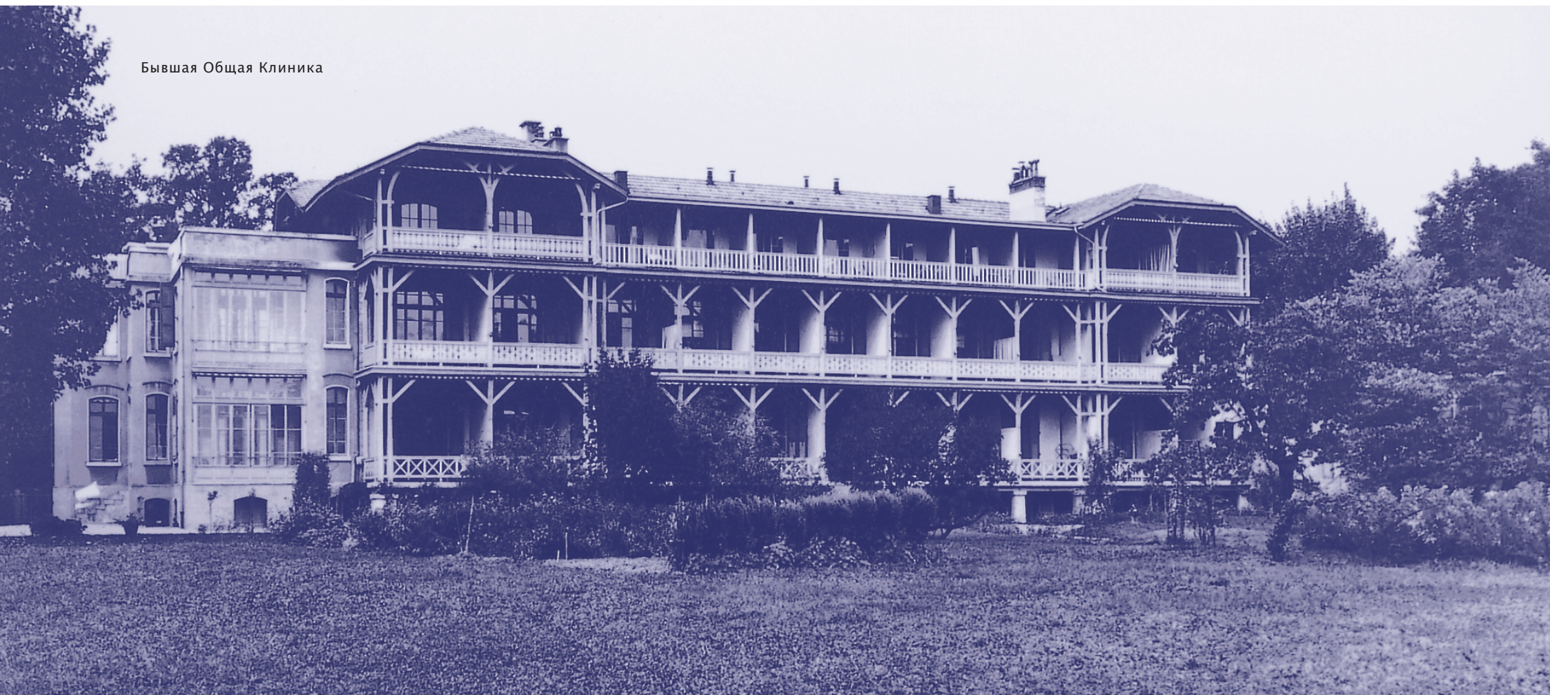
Бывшая Общая Клиника