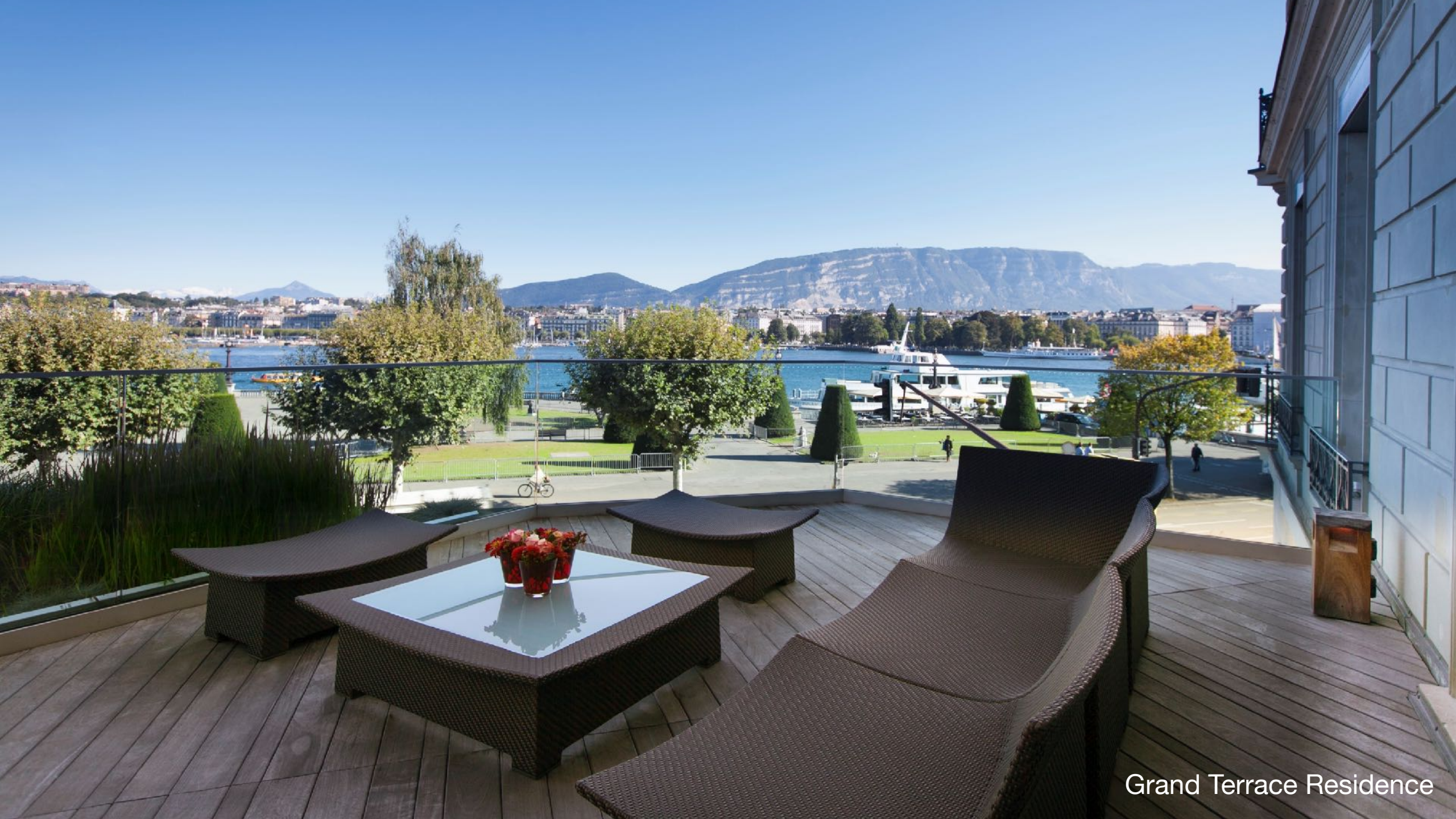
Grand Terrace Residence