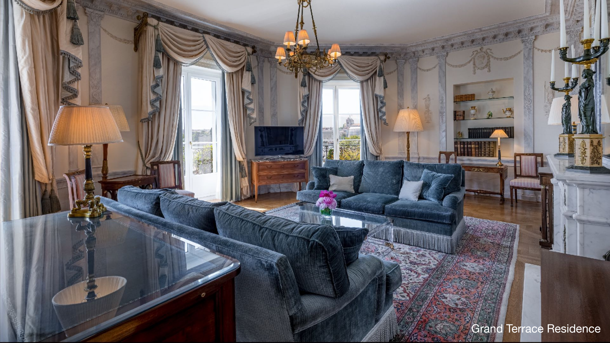
Grand Terrace Residence