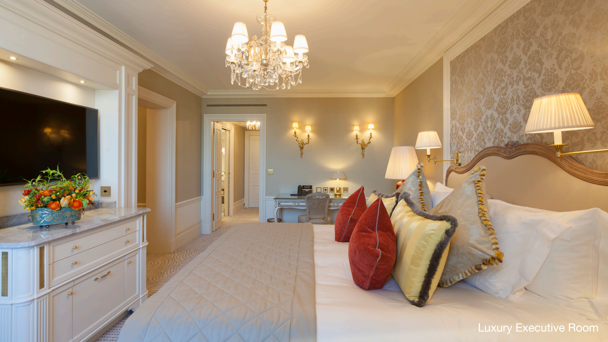
Luxury Executive Room