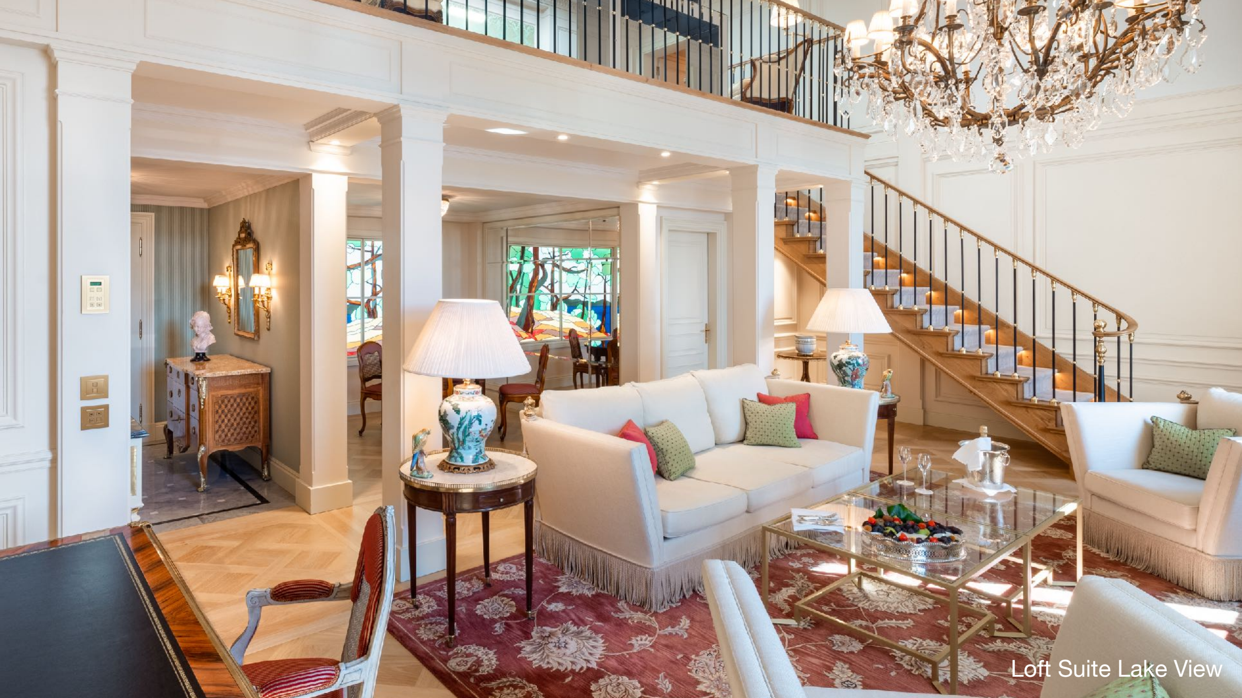
Loft Suite Lake View