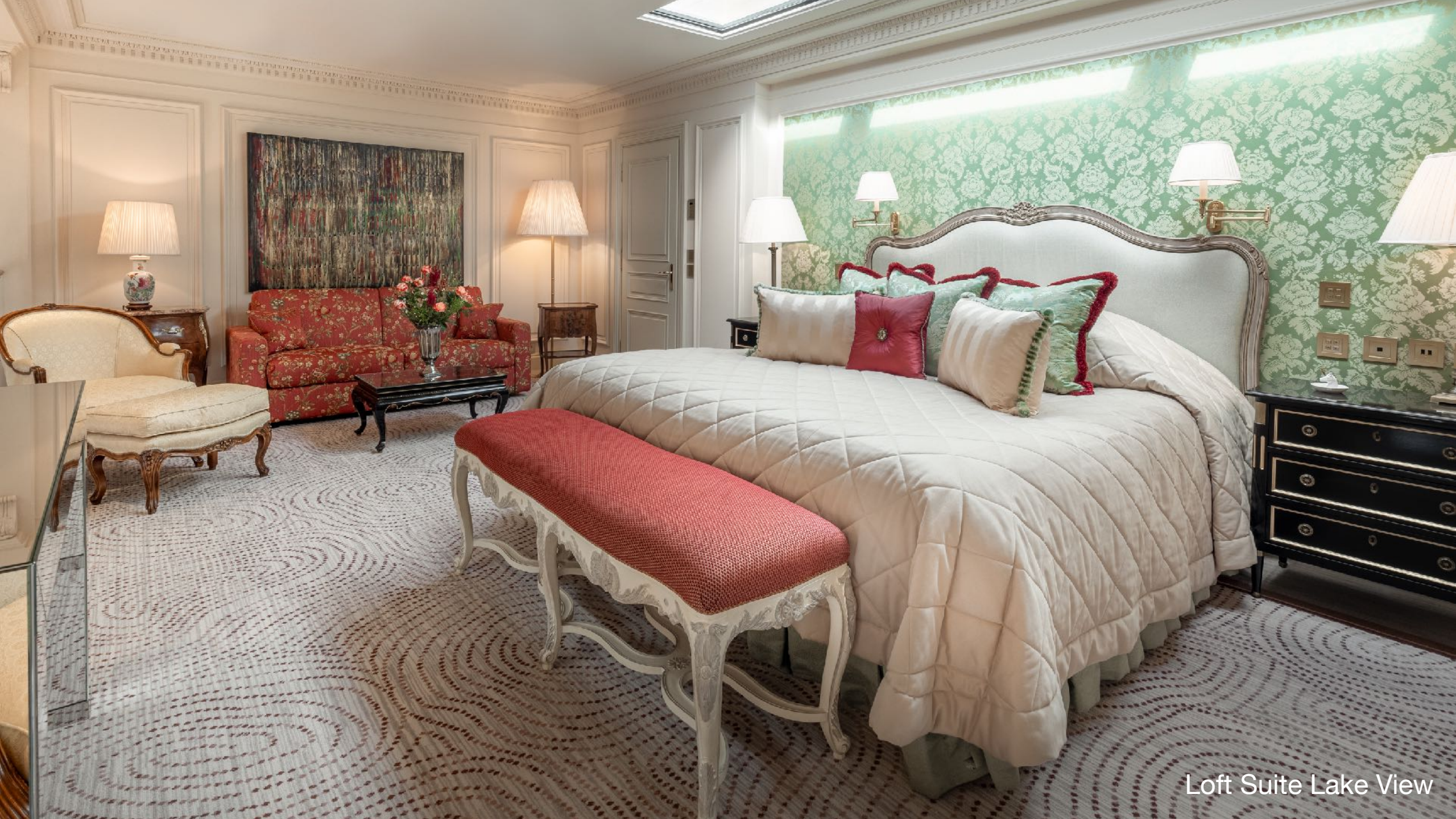
Loft Suite Lake View