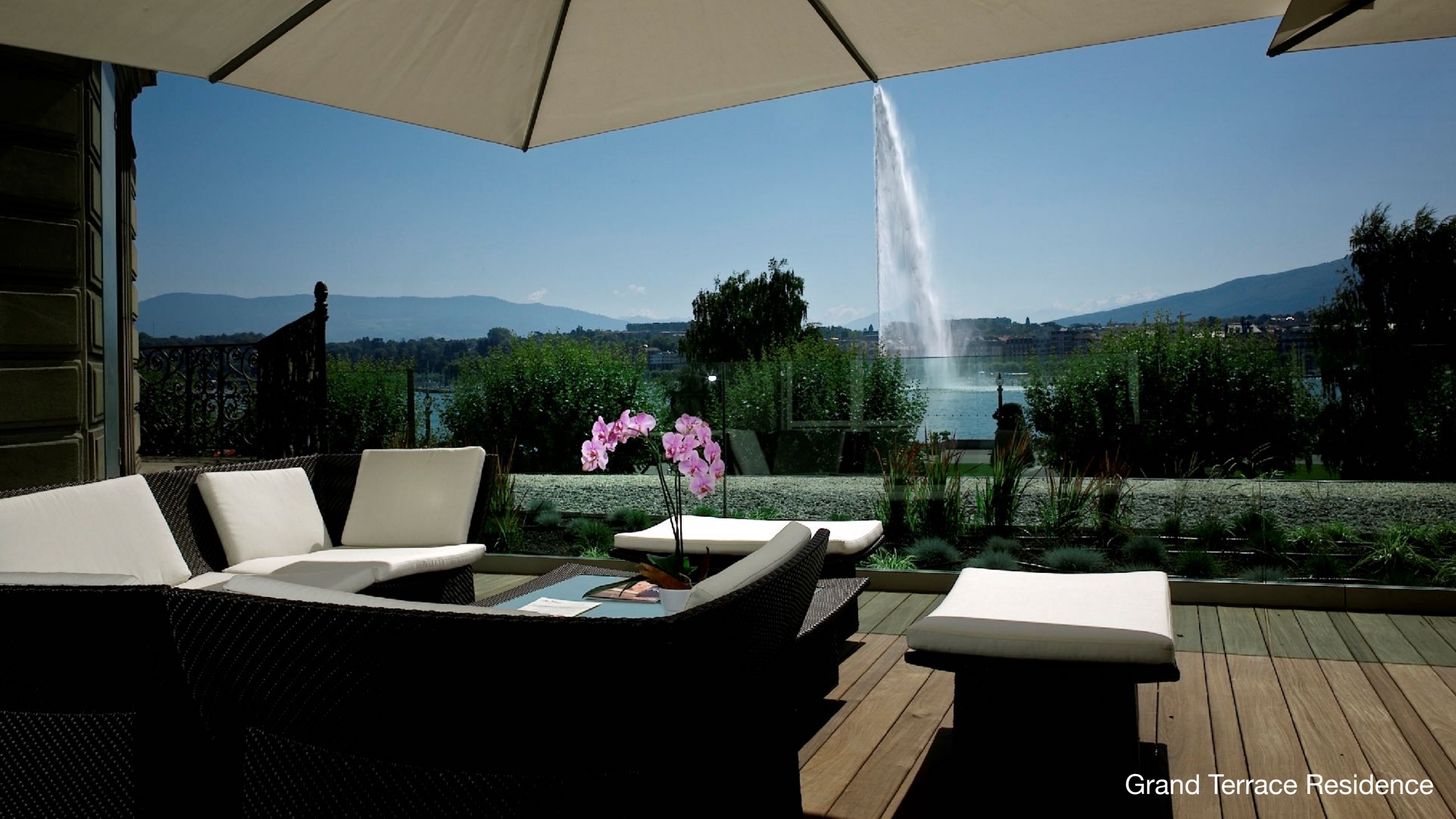
Grand Terrace Residence