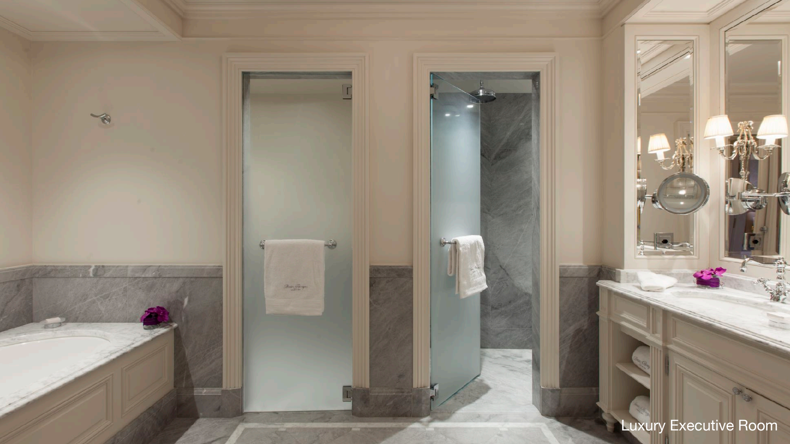
Luxury Executive Room