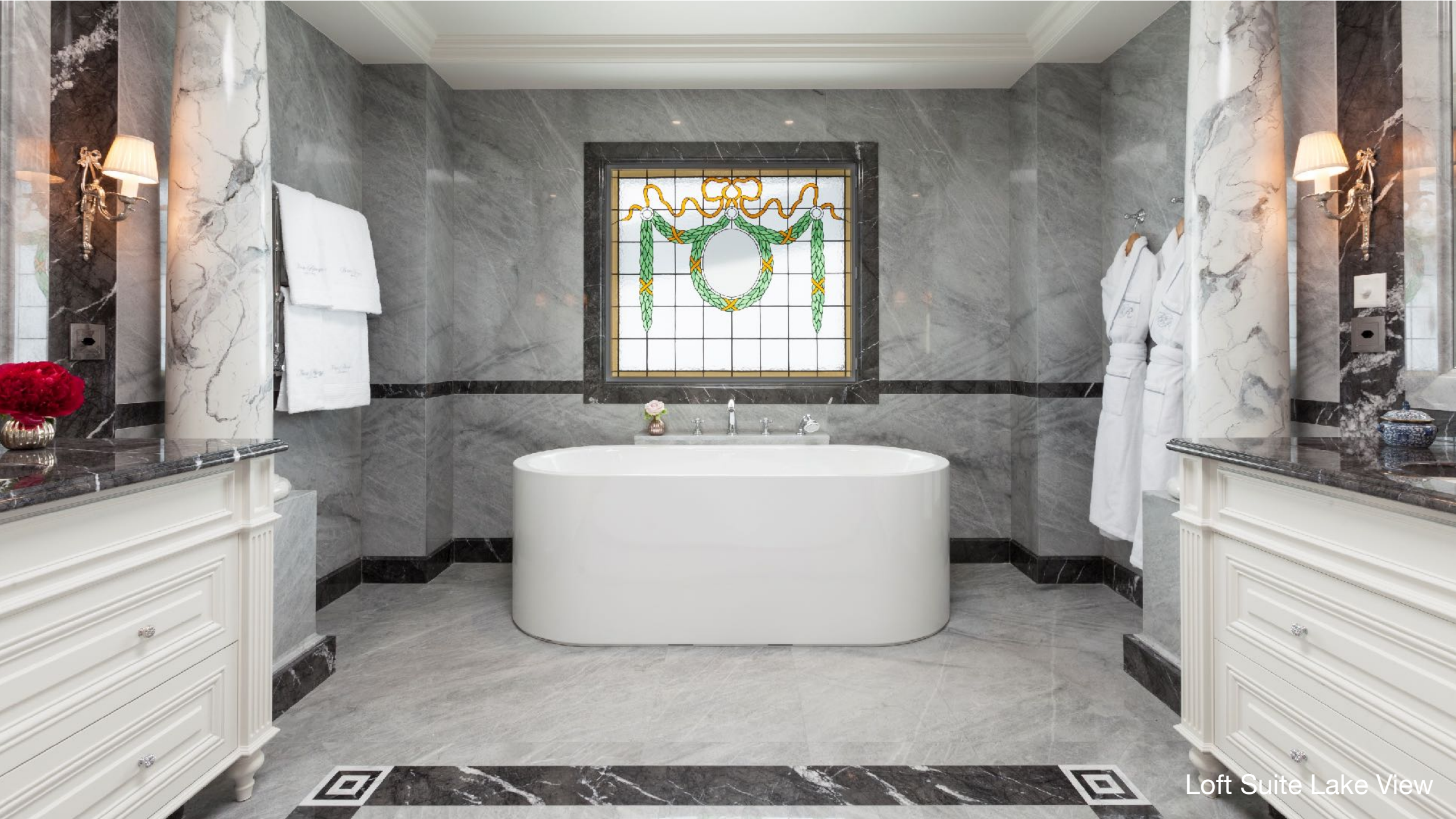
Loft Suite Lake View