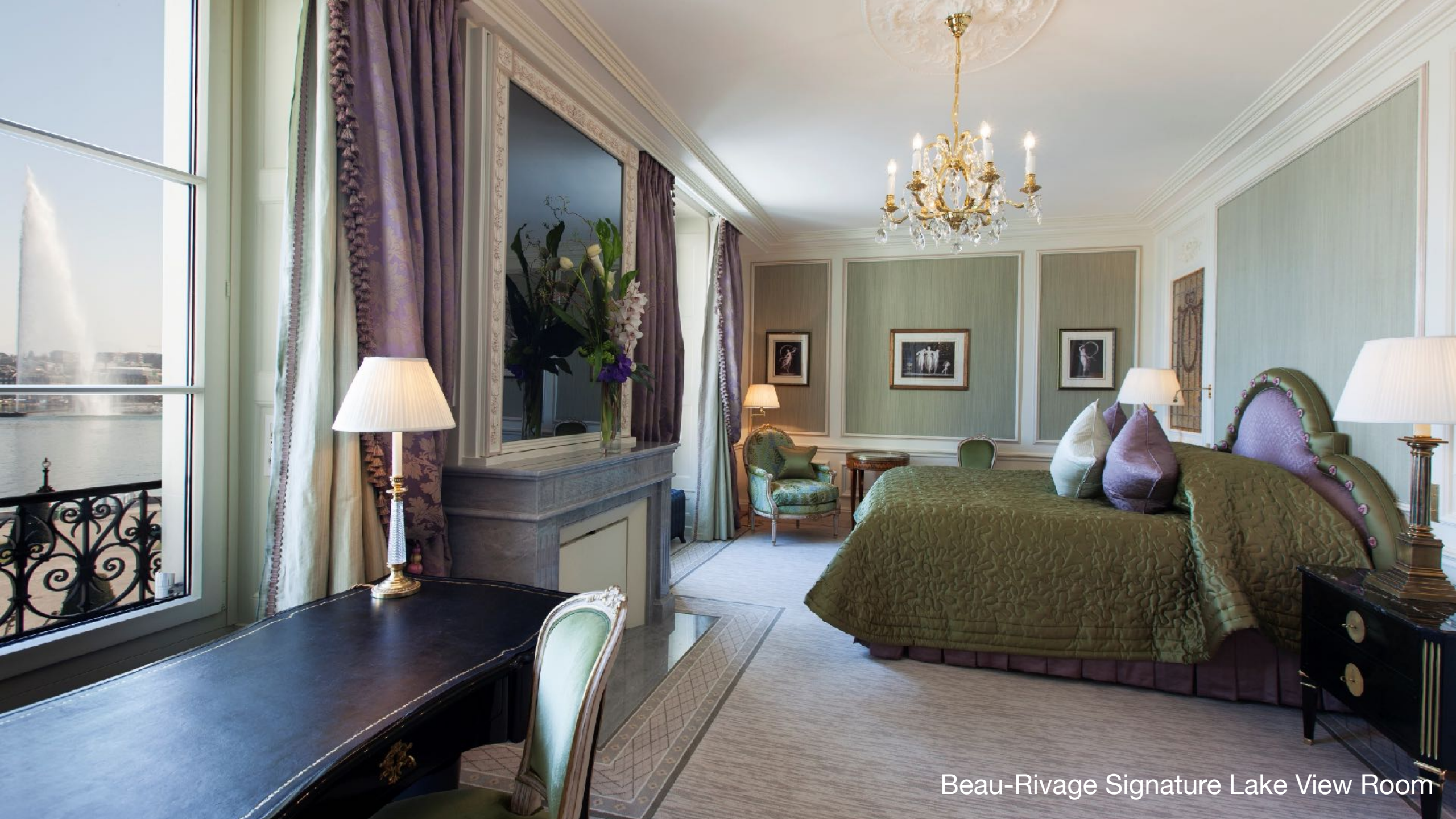
Beau-Rivage Signature Lake View Room