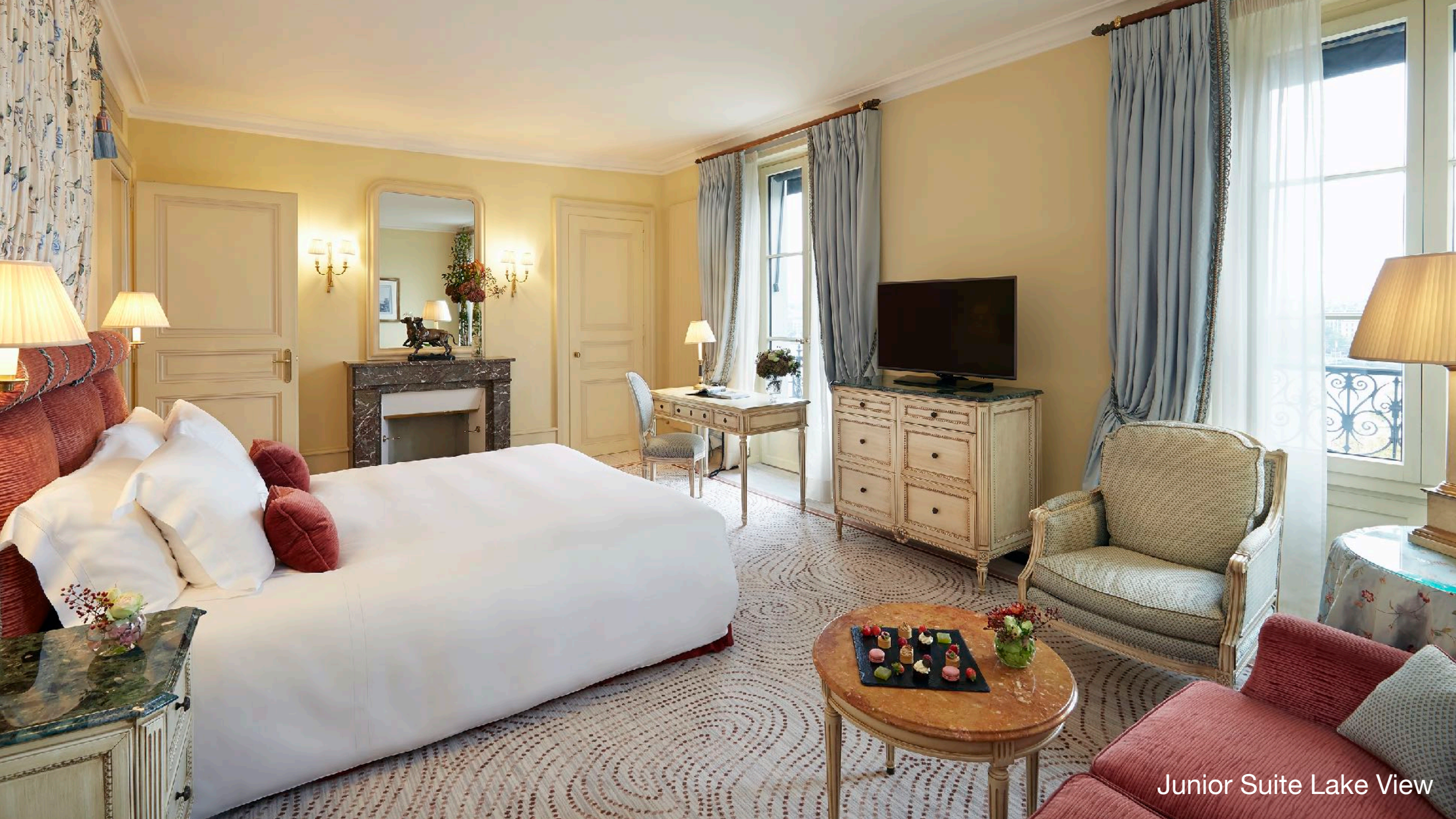
Junior Suite Lake View