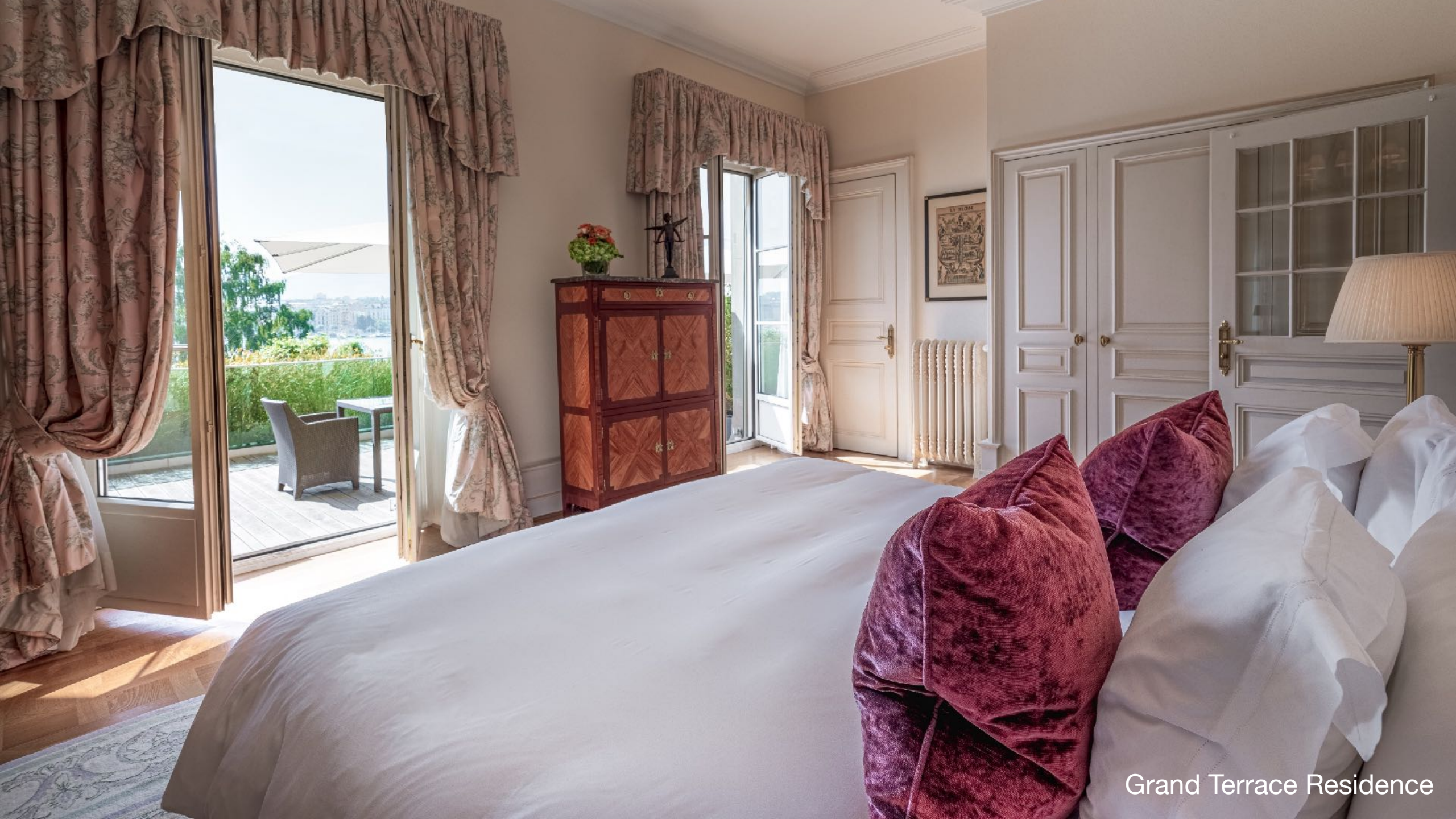
Grand Terrace Residence