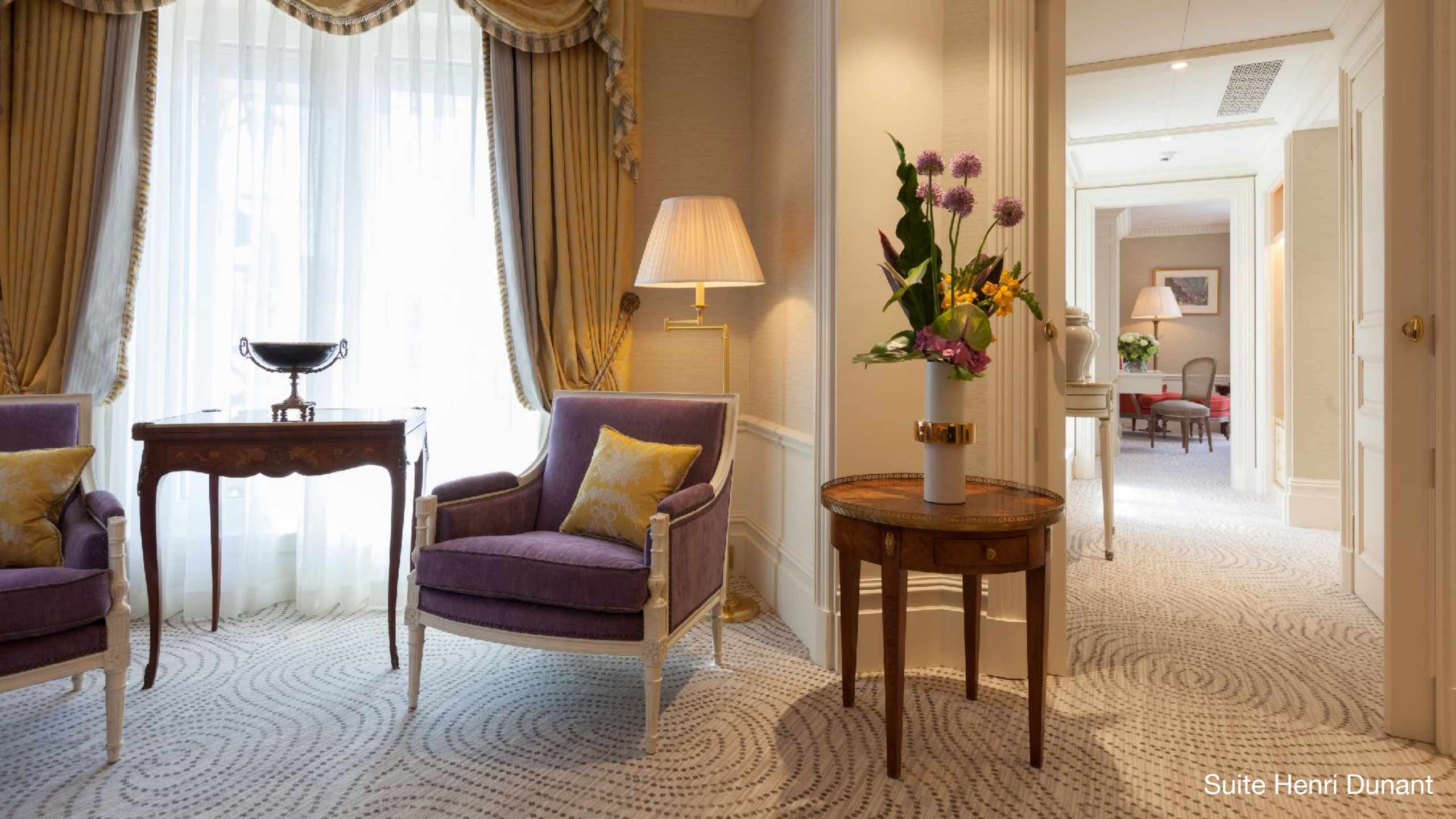
Suite Henri Dunant