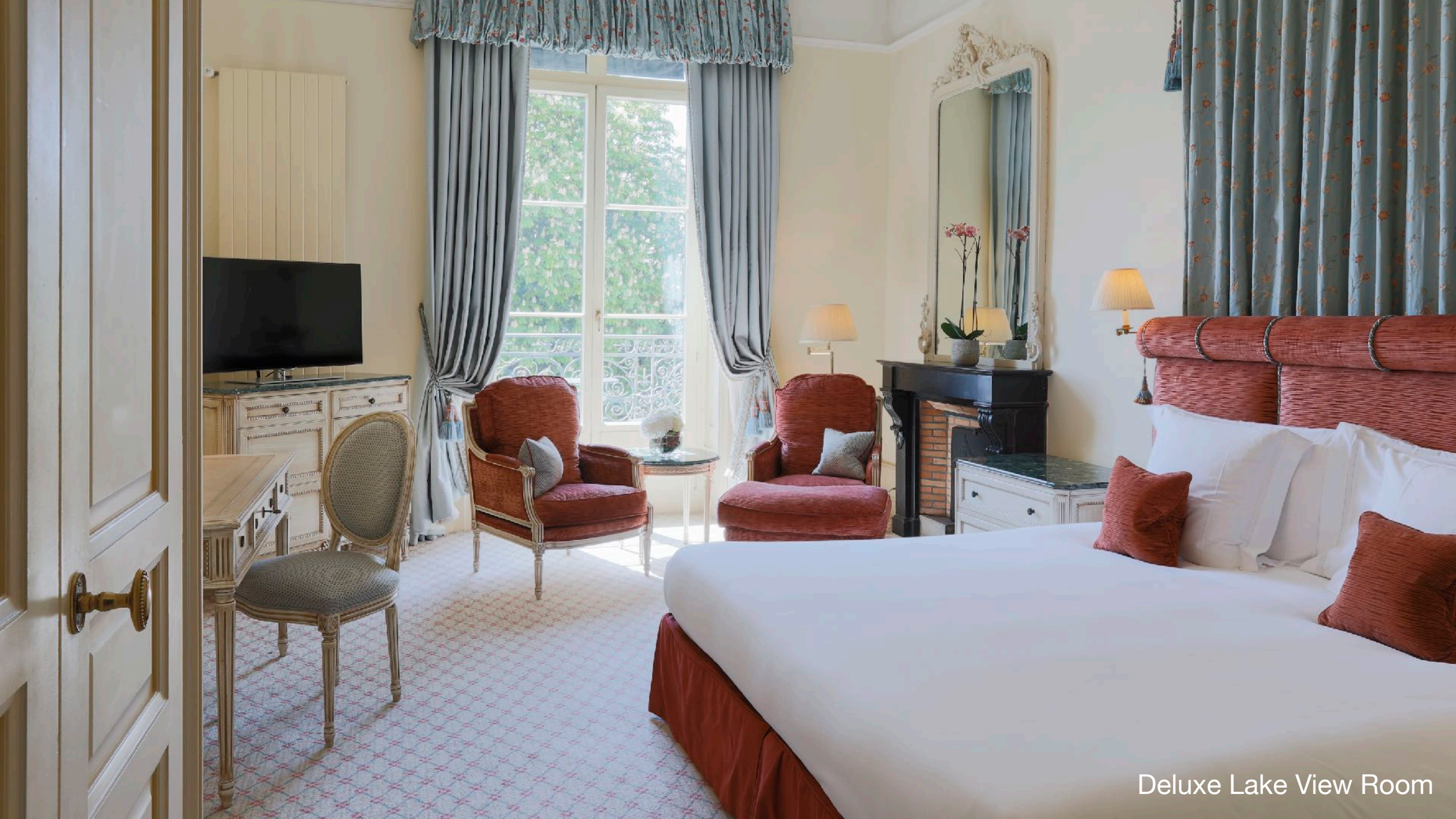
Deluxe Lake View Room