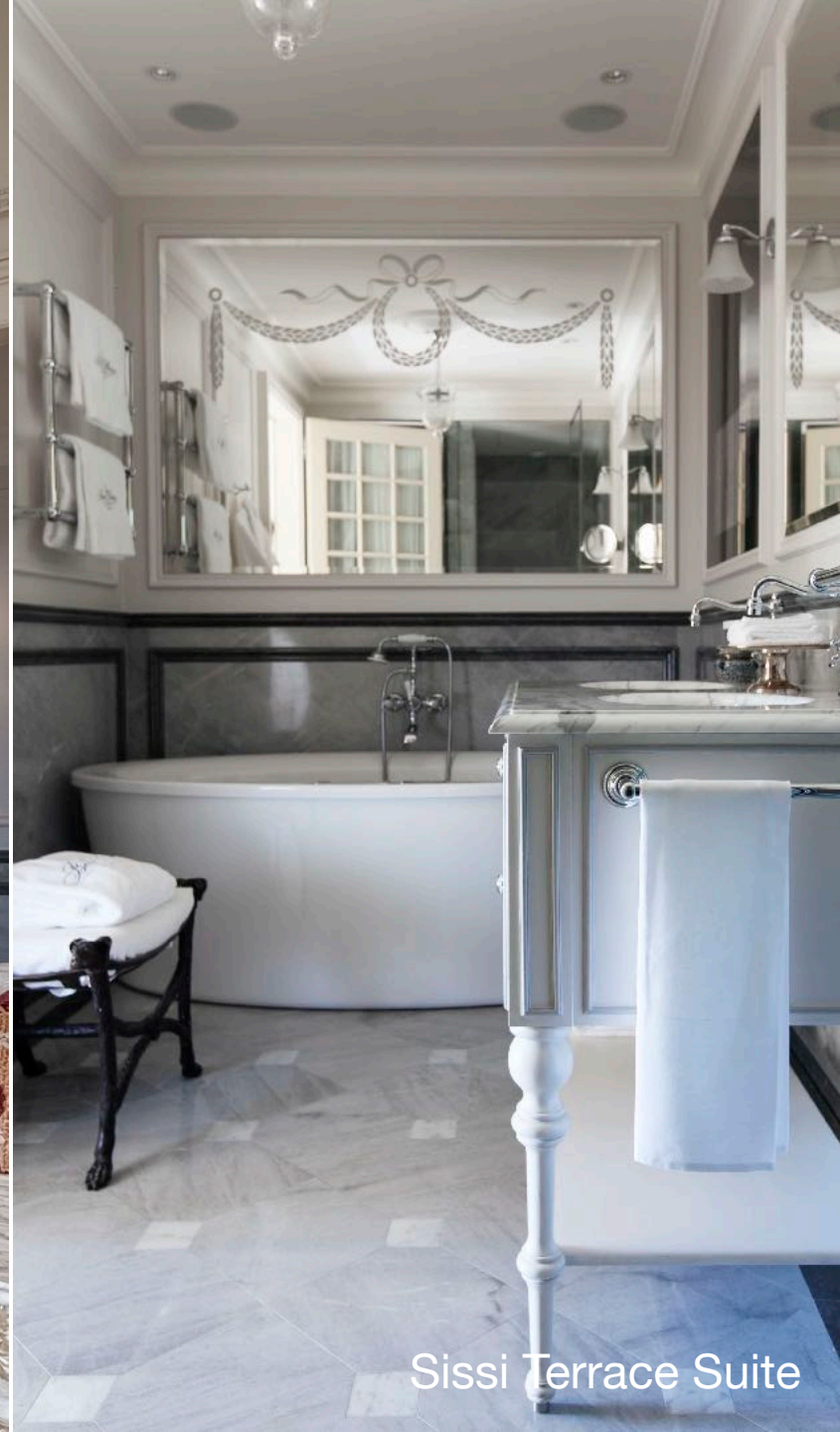
Sissi Terrace Suite