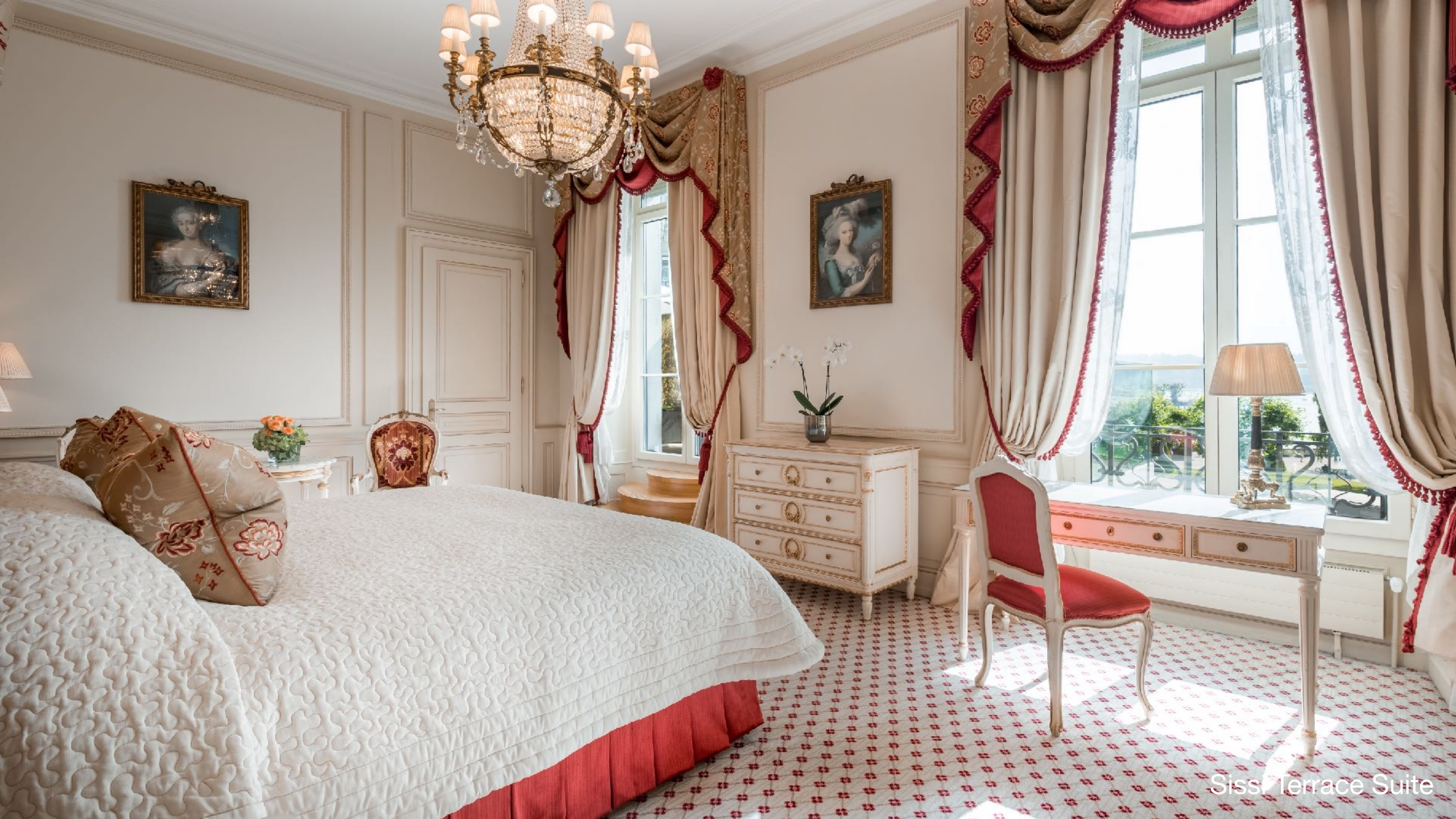
Sissi Terrace Suite