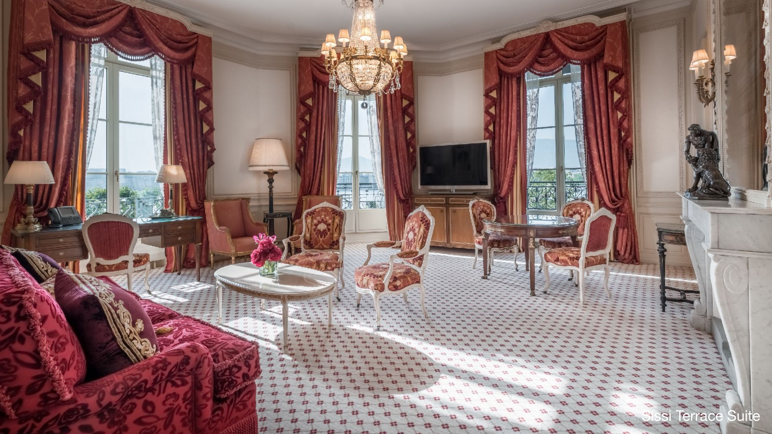
Sissi Terrace Suite