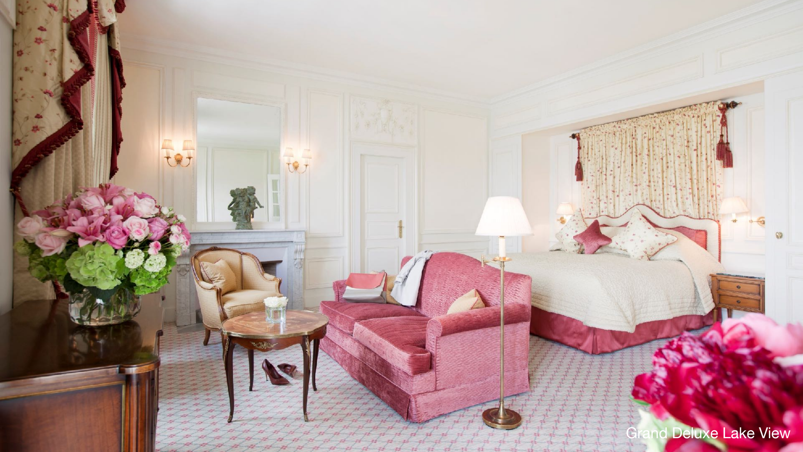
Grand Deluxe Lake View