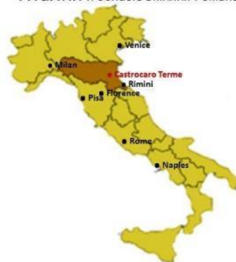
Италия и область Эмилия Романья

История Grand Hotel & SPA идёт одним шагом с историей курорта, на сегодняшний день считающегося жемужиной итальянской термальной индустрии. И следы его славного прошлого всё ещё остаются в стенах его неординарной архитектуры и утончённой атмосфере, дарящей своим гостям безмятежный отдых и спокойствие. Здание, спроектированное Тито Кини, представляет собой один из наиболее ярких примеров итальянского Ар Деко, выполненного в мастерской керамики Борго Сан Лоренцо.