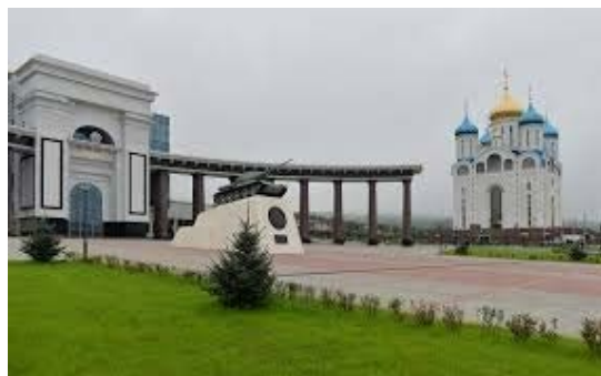
в один голос утверждают, что останец является не