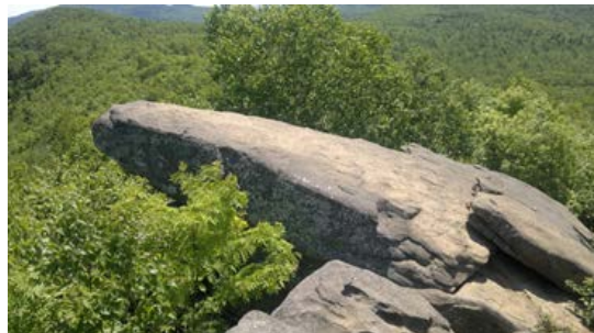
Здесь можно встретить камни «желаний» и «вопросов-ответов».