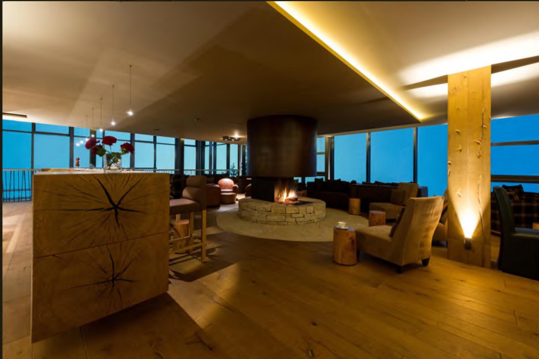
Лаундж-бар 180°- «Место, в котором следует быть »