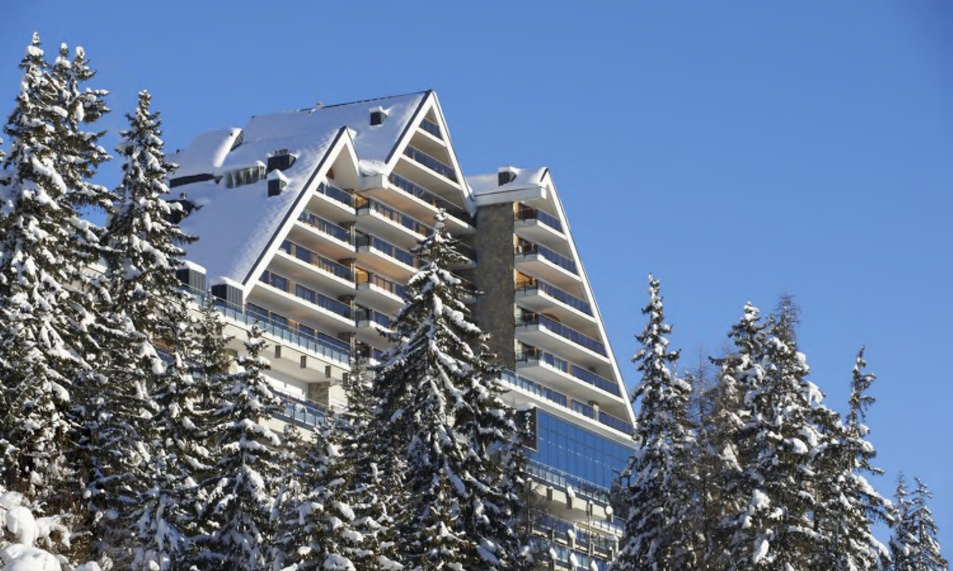
Новый 5 *отель на 1.500 м. высоте с 60 номерами и сьютами Отель «Ski-in / Ski-out» в непосредственной близости от телекабин Монтана-Сигнал-Кри Д Эр