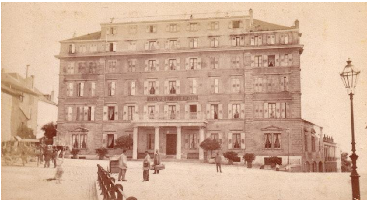
Grand Hôtel Gibbon, Lausanne, 1839-1920