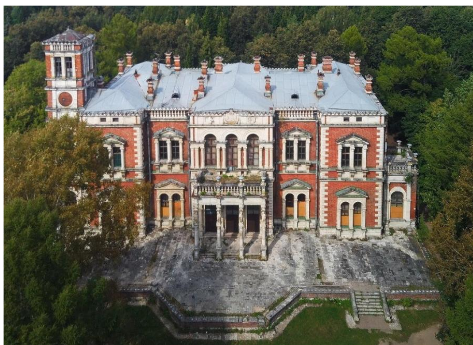
Дворец Воронцовых-Дашковых в Быково