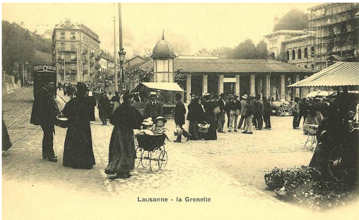
Place la Grenette, Lausanne

Еще один значимый для города проект - площадь Гренетт, la Grenette. На фото ниже Вы можете узнать Дворец Рюмина (справа), построенный на площади Гренетт в 1898-1906 на деньги, завещанные уроженцем Лозанны русского происхождения Габриэлем Рюминым.