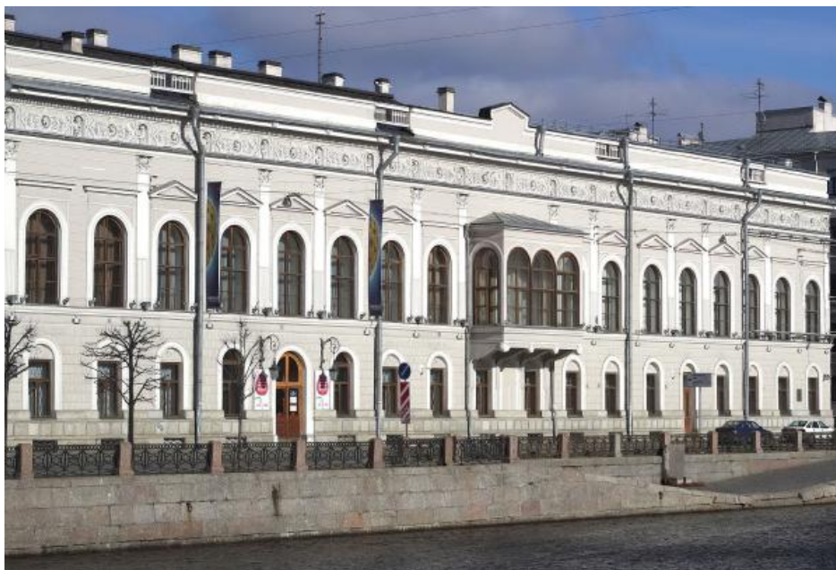
Дворец Нарышкиных-Шуваловых, Санкт Петербург В наше время – Музей Фаберже