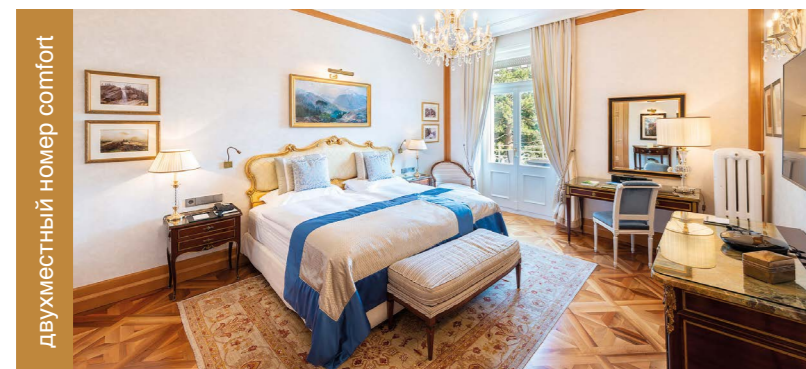
двухместный номер comfort

7 ночей проживания и 6 дней Детокс программы: