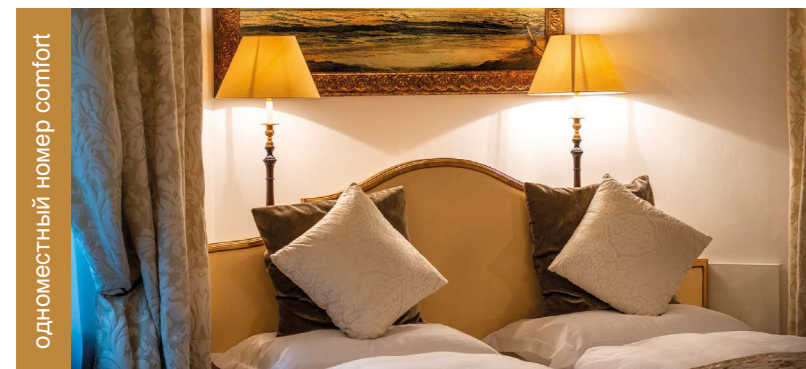
одноместный номер comfort

7 ночей проживания и 6 дней Детокс программы: